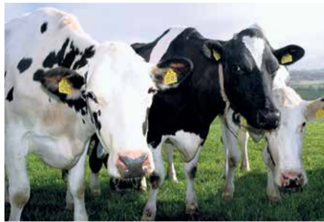
Flere og flere mælkeproducenter overvejer at omlægge til økologi, og det kan der være god økonomi i, vurderer rådgivere fra LMO.

- Det er meget positivt, at der kan flyttes produktion fra konventionel til økologisk, da det øger den samlede omsætning i dansk mælkeproduktion. Dermed er der også mulighed for en bedre bundlinje hos vores kunder, siger kvægchef Christian Børsting fra LMO og fortsætter: